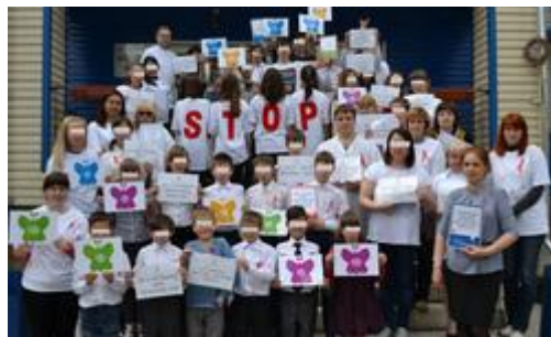
Воспитанники «Акварели» — активные участники городских мероприятий, посвященных ВИЧ

Меньше всего шансов на приемную семью у тех, кто уже вырос. Но недавно произошло чудо: из детдома забрали 16-летнего парня — одного из первых, кто поступил в детдом с диагнозом ВИЧ лет 10 назад. «Его мама была наркоманка, во время беременности на учете не стояла, и он родился с глубокой асфиксией. Был настолько слаб, что просто лежал на палате, математикой и русским