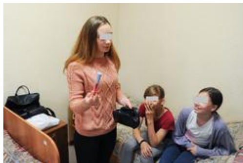
Девчонки хвастаются своей косметикой