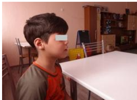
По словам педагогов, любой ребенок, потерявший родителей, мечтает о семье