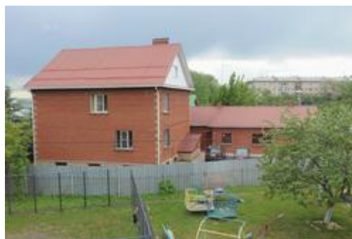
Следственный комитет находится по соседству — буквально за забором. Следователи — частые гости в детдоме

Показательным был случай со съемочной группой, которая отказалась ехать в детдом снимать детей для паспортов. Другой яркий пример — поступок директора оздоровительного лагеря. «Наши сотрудники привезли детей в лагерь, но не успели они вернуться, как директор наших воспитанников с ветерком на личной машине привез обратно», — вспоминает Ушакова.