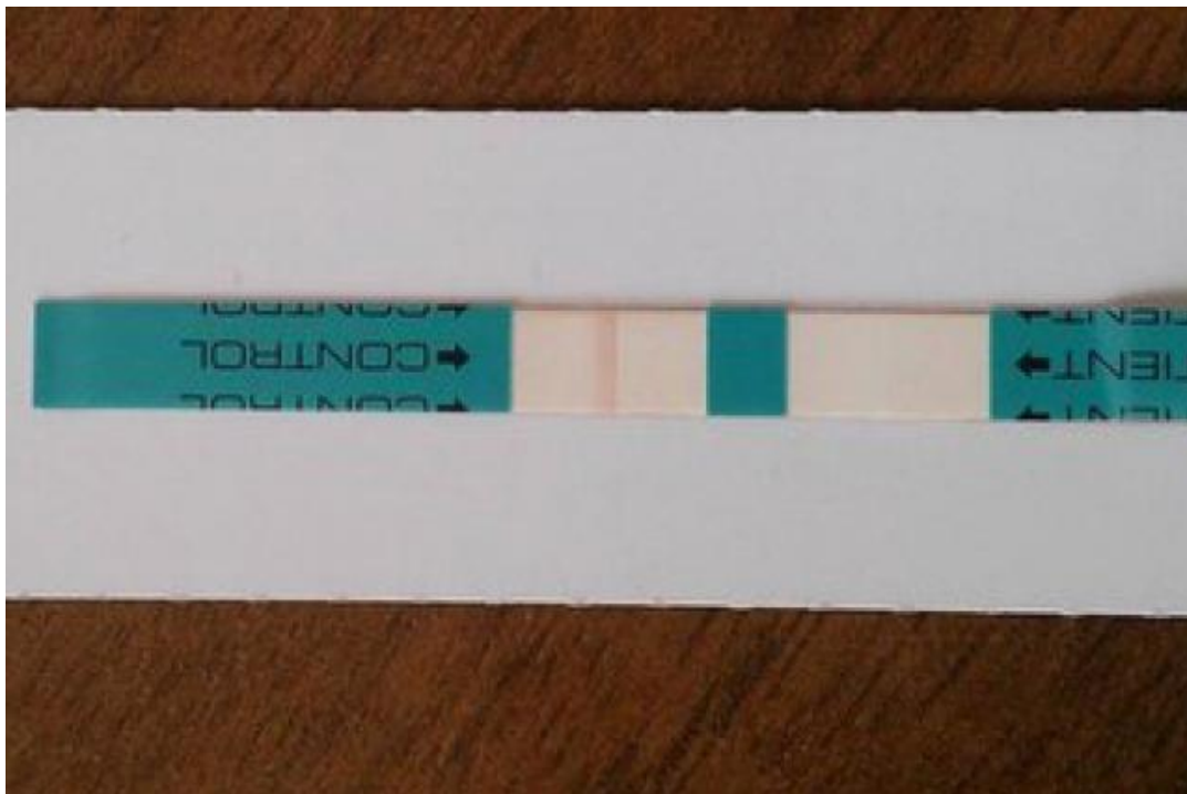
Это экспресс-тест на ВИЧ.